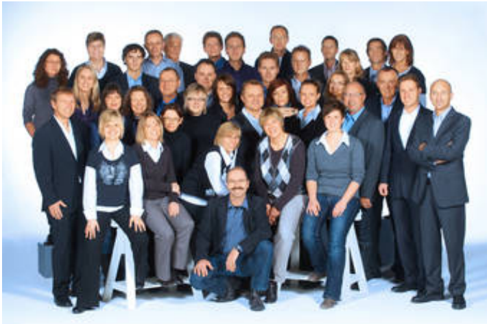
Ihr Katalog-Team in Gütersloh

Klicken Sie auf das Bild um eine größere Ansicht zu erhalten.