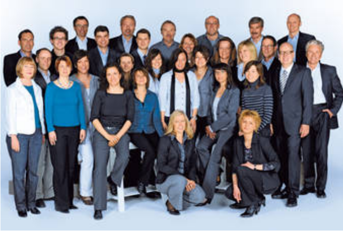
Ihr action print-Team in Gütersloh

Klicken Sie auf das Bild, um eine größere Ansicht zu erhalten.